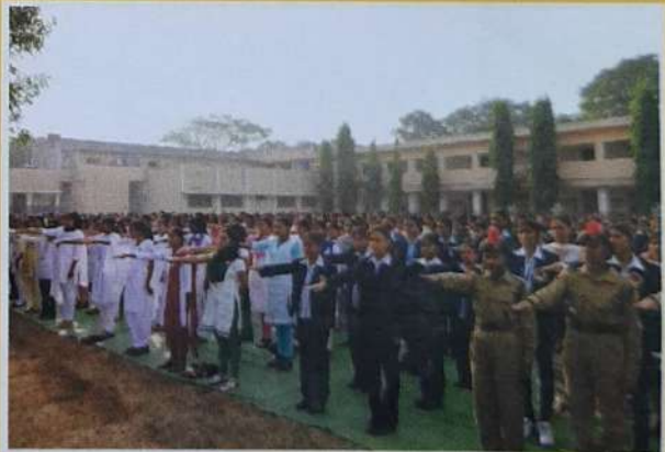
Students taking 'Oath of Voting' on 26th January