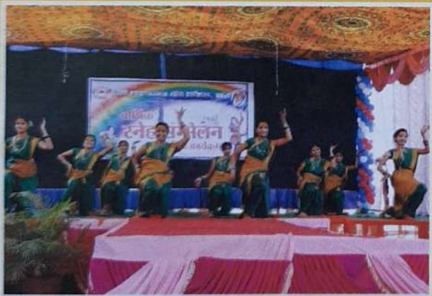
Cultural Event in Annual Gathering