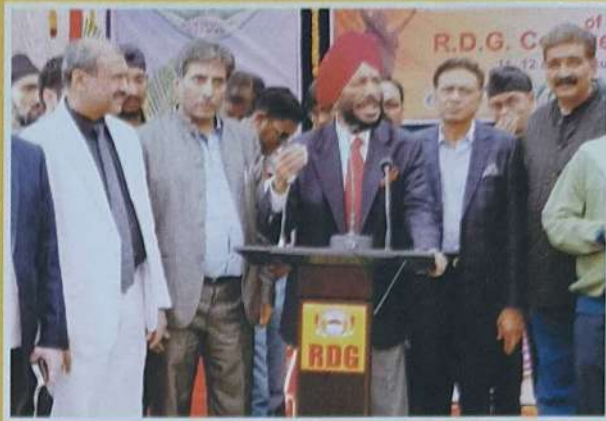
Milkha Singh in Annual Gathering