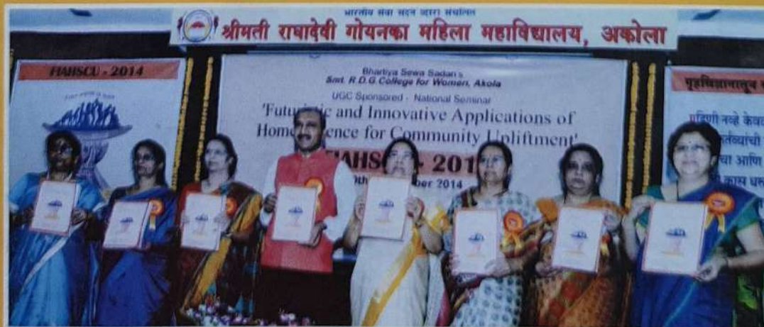
UGC Sponsored National Seminar FIAHSCU - 20th Sept 2014 Inauguration & Souvenir Release