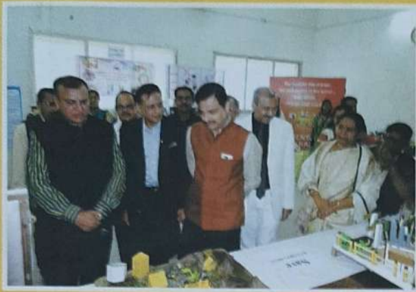
Civic Sense Exhibition - Visit by LMC Members