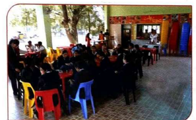
कॉलेजच्या आवारातील विद्यार्थीनींसाठी सर्व सुविधायुक्त हायजेनिक कॅटीन फॅसिलिटी