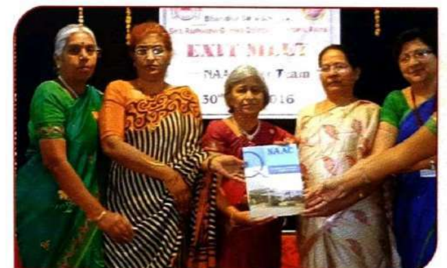
महाविद्यालयास अंतिम अहवाल सादर करतांना नॅक पिअर टिम