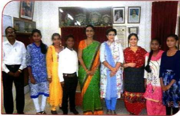
'रायटर्स बँक' या उपक्रमा अंतर्गत दृष्टीहीन विद्यार्थ्यांचे रायटर्स म्हणून परिक्षा देणाऱ्या विद्यार्थीनी