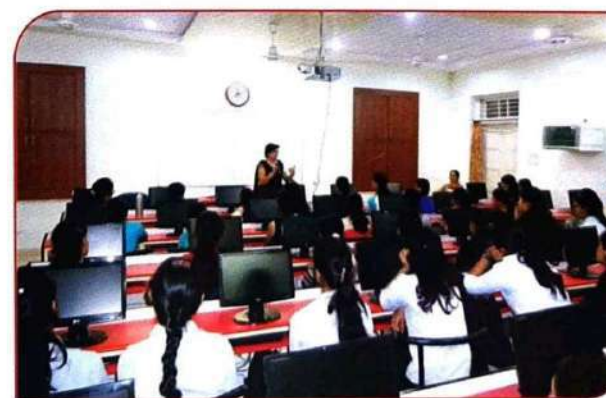
वायफाय सुविधायुक्त कम्प्यूटर लॅब मध्ये प्रशिक्षण घेतांना विद्यार्थीनी