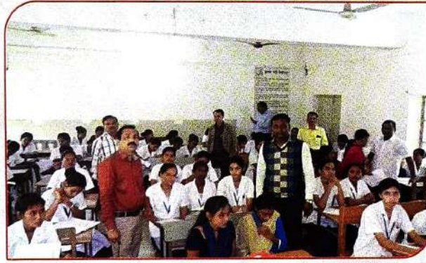
रोजगार व कौशल्य विकास मार्गदर्शन मेळाव्यात सहभागी विद्यार्थीनी