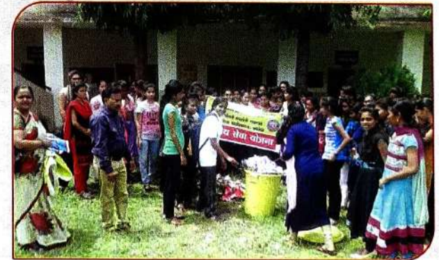
राष्ट्रीय सेवा योजना अंतर्गत महाविद्यालयीन परिसरात स्वच्छता मोहिम राबवितांना विद्यार्थीनी व प्राध्यापक