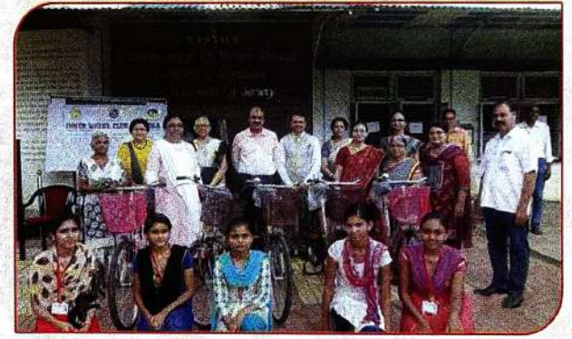
इनर व्हिल क्लब व राधे मंडल तर्फे महाविद्यालयातील गरजू विद्यार्थीनींना साईकल वाटप