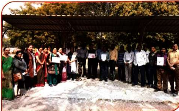
'No Vehicle Day' मध्ये सहभागी महाविद्यालयाचे प्राचार्य, प्राध्यापक व कर्मचारीवृंद