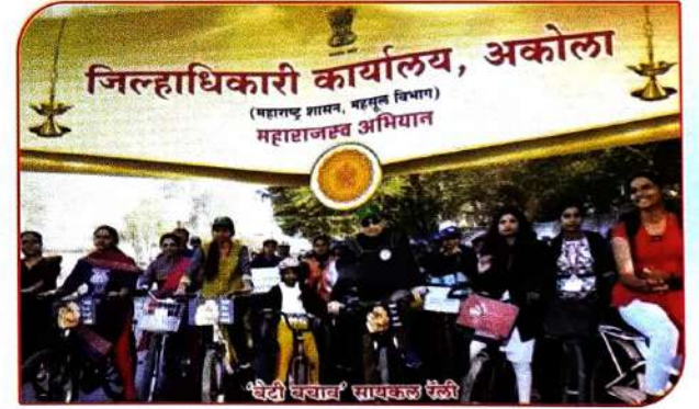
जिल्हाधिकारी कार्यालयाच्या दिनदर्शिकेवर मा.जिल्हाधिकारी यांच्या समवेत महाविद्यालयीन विद्यार्थीनी 'बेटी बचाओ' सायकल रॅली दरम्यान