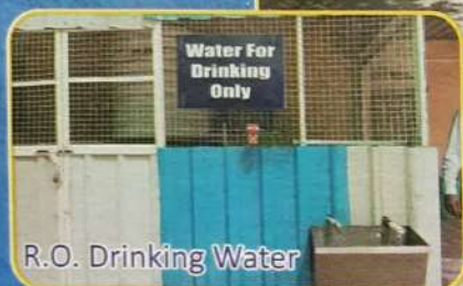
R.O. Drinking Water