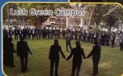
Lush Green Campus