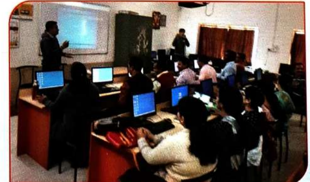
महाविद्यालयाने घेतलेल्या ICT कार्यशाळेमध्ये सहभागी प्राध्यापक