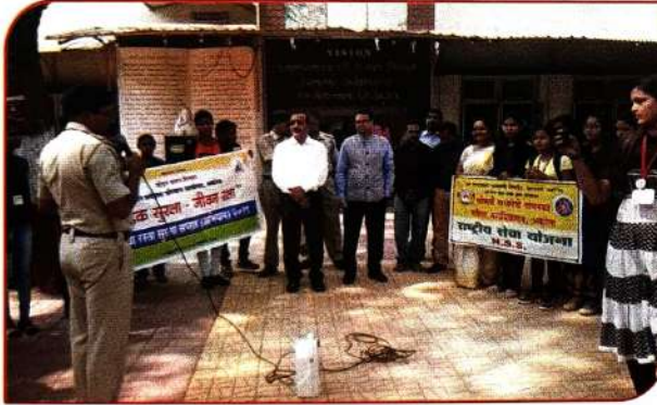
'सडक सुरक्षा सप्ताह' निमित्त आयोजित कार्यशाळेत रस्ता सुरक्षे संदर्भात माहिती देतांना परिवहन अधिकारी व लाभ घेतांना महाविद्यालयाचे प्राचार्य, कर्मचारीवृंद व विद्यार्थीनी