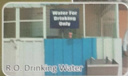
R.O. Drinking Water