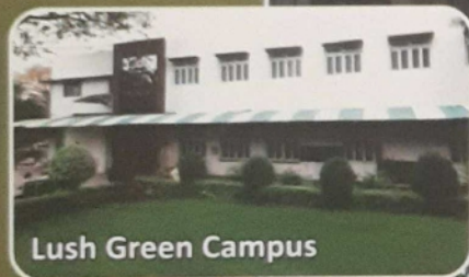
Lush Green Campus